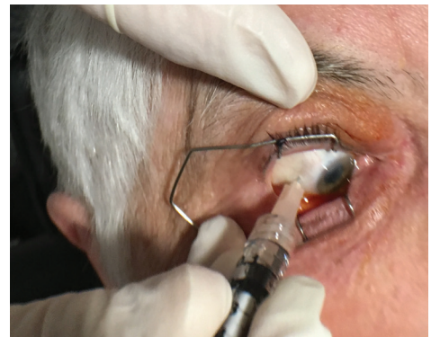
Figura 1 Inyección intravítrea de un fármaco contra el VEGF.