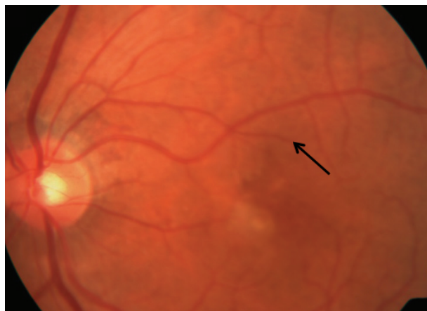
Figura 2 AMD húmeda. Neovascularización coroidea (indicada con la flecha).

En la AMD húmeda, existe una disminución repentina o gradual de la agudeza visual, puntos ciegos en el centro de la visión y distorsión de líneas rectas. El signo distintivo de la AMD húmeda es la neovascularización coroidea ( choroidal neovascularization, CNV ) ( Figura 2 ).